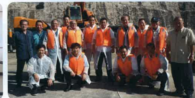
総務企画委員会 北大東村視察