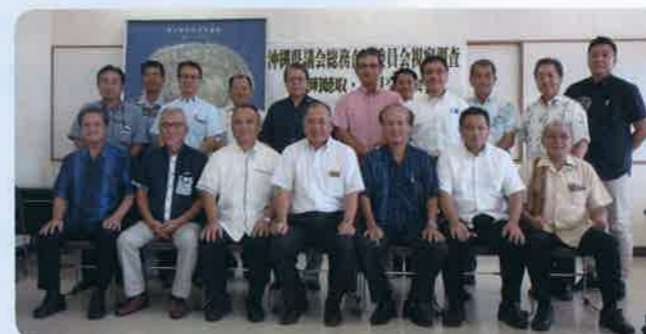
総務企画委員会 南大東村視察