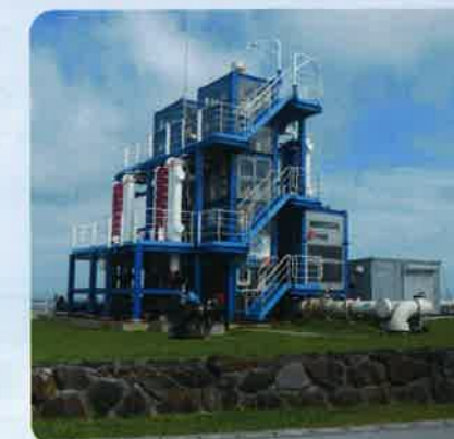
県海洋温度差発電実証設備