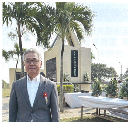
8月13日～ 南米視察 (ポリビア移住70周年慰霊祭)