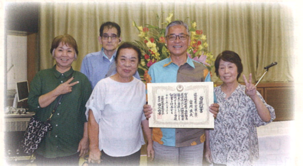
6月20日 兄妹との当選証付与式

県民の代弁者として批判や否定ではなく提案・提言をする議員活動に取り組んで参ります。